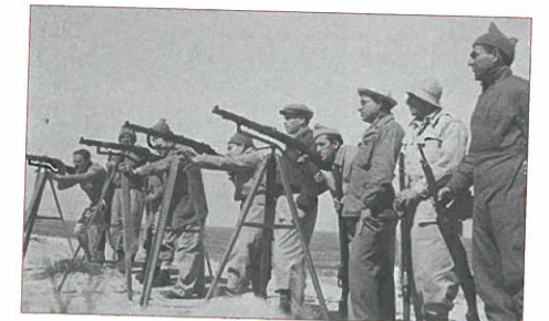
חיילי צה"ל באימונים. בתמונה כולט חוסר האחידות בצבעי בגדי החיילים ובצורתם. משום שזמן רב חלף עד שלצבא החדש היו מדים רשמיים ומסודרים. רק לקראת סוף המלחמה התקבלו קצת מדים בתרומות, והחיילים הביאו בגדי חאקי נוחים מהבית.

המשמעות הישירה של פקודת הקמת צה"ל הייתה פירוק המחתרות. בפועל צה"ל המשיך במידה רבה את המבנה של ההגנה, כיוון שהיא הייתה הארגון הגדול ביותר. שתי המחתרות האחרות שולבו בשורות צה"ל. האצ"ל, שהיה ארגון גדול יחסית, השתלב בצה"ל כגדודים שלמים של אנשי האצ"ל, שמפקדיהם היו גם כן אנשי האצ"ל, ואילו אנשי לח"י צורפו לחטיבה 8 המשורינית בפיקודו של יצחק שדה.