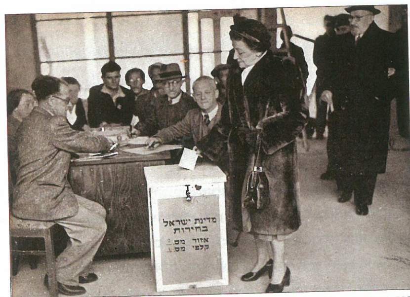
הבחירות הראשונות: ורה ויצמן, אשתו של נשיא המדינה, מצביעה בבחירות הראשונות של מדינת ישראל. חיים ויצמן עומד מאחוריה.