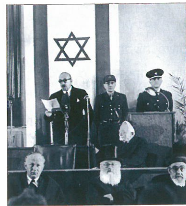
ההשבעה לנשיאות בכניין המוסדות הלאומיים.

מדינת ישראל שומרת עד היום על המשטר הדמוקרטי שלה. אולי זה נראה לנו מובן מאליה היום, אבל מכל עשרות המדינות הדמוקרטיות שהוקמו באסיה ובאפריקה בעשרים השנים שאחרי מלחמת העולם השנייה, רק הודו וישראל נותרו דמוקרטיות יציבות. נראה כי הדמוקרטיה היציבה במדינת ישראל נובעת מכמה סיבות. הראשונה: גם הקהילות היהודיות בגולה התנהלו מבחינות מסוימות בצורה דמוקרטית. השנייה: הקונגרס הציוני הראשון - אבן הבניין הראשונה בתהליך להקמת מדינת ישראל - התנהל בצורה דמוקרטית. ושלישית: הדמוקרטיה הושרשה כבר בימי המנדט, במוסדות 'המדינה שבדרך'.