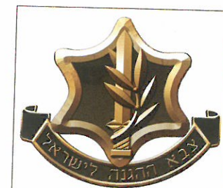
סמל צה"ל - צבא ההגנה לישראל

בירושלים, שרשמית לא הייתה שייכת לשטחי מדינת ישראל (לפי תכנית החלוקה היא הייתה אמורה להיות בשלטון בין לאומי), רק ההגנה הפכה לחלק מצה"ל, והאצ"ל והלח"י המשיכו להילחם באופן זמני כקבוצות נפרדות ועצמאיות, שפעלו תוך שיתוף פעולה ביניהן. אף שהממשלה הזמנית הסכימה לזה, הדבר מראה על חולשה בתחומי שלטונה ובאחדותה של המדינה - ולכן עורר בעיות בהמשך.