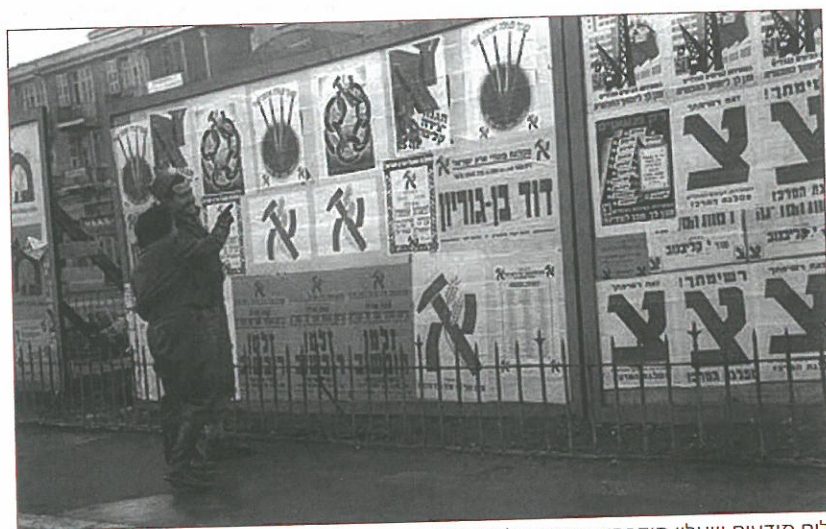
לוח מודעות שעליו מודבקות כרזות של המפלגות השונות, לקראת הבחירות הראשונות.

עוד במהלך מלחמת העצמאות, לפני סיום חתימת הסכמי שביתת הנשק, הושלם תהליך כינון מוסדות השלטון הרשמיים של מדינת ישראל: ב-25 בינואר 1949 נערכו הבחירות הראשונות ונבחרה אספה מכוננת שהייתה למעשה לכנסת הראשונה של מדינת ישראל. הבחירות הראשונות עוררו עניין רב והתרגשות גדולה. לראשונה מזה אלפיים שנה העם היהודי זוכה לריבונות על עצמו ועל אדמתו. אחוזי ההצבעה בבחירות אלו היו הגבוהים ביותר (כ-87%), מאז עד היום.