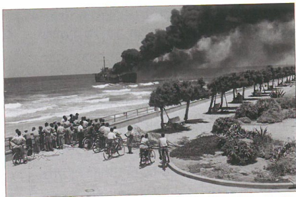
אלטלנה כוערת מול חוף תל אביב

כדי לחזק את כוחה של מפלגתו מפא"י כמפלגת השלטון, ולמנוע מבגין להיות יריב פוליטי חזק. כלומר, השאלה היא אם בן גוריון פעל בפרשייה זו באופן צודק וסביר, או שמניעים פוליטיים מפלגתיים וגישה בלתי סובלנית כלפי גורמים שונים ממנו דחפו אותו למעשה תוקפני מדי.