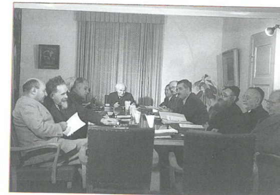
אחת מישיבות הממשלה הזמנית במרכז יושב בן גוריון, ראש הממשלה, שני מימין הוא הרב יהודה לייב מימון, נציג המזרחי, מימין הרב יצחק מאיר לוי, נציג אגודת ישראל

הגופים הללו החליפו למעשה את המערכת הפוליטית שהייתה ליישוב בתקופת המנדט (שעליה למדנו בפרק 5), אך היה הבדל אחד ביניהם: המוסדות הזמניים החדשים כללו נציגים גם מקרב אגודת ישראל, שלא הייתה חלק מהמוסדות היישוביים בתקופת המנדט, מכיוון שכעת, משהוקמה המדינה, כל המפלגות הפוליטיות של היישוב היהודי בארץ הפכו לחלק ממנה (שלא כמו בתקופת המנדט, שבה יכלה כל קבוצה להחליט שהיא פורשת ממוסדות כנסת ישראל ומנהלת את ענייניה בעצמה). אגודת ישראל הלא ציונית, שבתקופת המנדט התנגדה לשיתוף פעולה עם המוסדות היישוביים, שינתה את דעתה עם קום מדינה: רוב החרדים ונשותיהם השתתפו בבחירות הראשונות, ונציגיהם היו חברים בממשלה הזמנית ובממשלה הראשונה. עם פרוץ מלחמת העצמאות אף קרא מרכז אגודת ישראל בירושלים