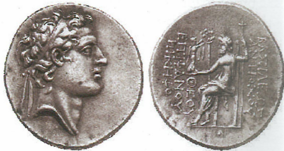
מטבע מעכו ועליו דיוקנו של אנטיוכוס הרביעי (אפיפאנס), בצד השני האל זאוס יושב על כסא ומחזיק בידו באלה ניקה, אלת הניצחון