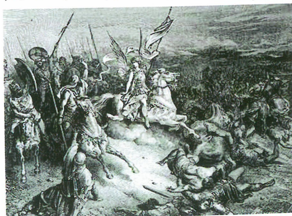
ניצחונות יהודה המקבי ציור של גוסטב דורה, צייר צרפתי, 1830-1883

ניצחונות יהודה המקבי הושגו במידה רבה הודות לכישרונו הצבאי ולדבקותו בערכי המוסר של הדת היהודית. יהודה היה מנהיג כריזמטי שידע לנצל את יתרונות המודיעין המוקדם, ידע לנצל את הלילה למתקפה על האויב, להטעות את האויב, להפתיע ולהכותו בנקודות החלשות שלו. את הבנתו בצרכים המוסריים מוראליים גילה כאשר אסף את צבאו לפני הקרב במצפה, מקום מול ירושלים שבו נהגו בני ישראל להתאסף בתקופת בית ראשון ולקרוא בתורה. החזרה על הטכס המוכר עודדה את הלוחמים והגבירה את המוטיבציה להילחם. יחס אנושי ומשמעת עצמית גילה כאשר אסר על חייליו לקחת לעצמם מן השלל ופקד לחלקו לפצועים, לאלמנות וליתומים.