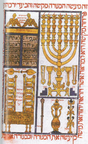
כלי בית המקדש מתוך תנ"ך מ ממיורקה, ספרד, 1244 בתמונה נראים המנורה, לוחות הב מחתות, כד שמן ושולחן לחם הפני

יצירת ה"דמוס" (חבר האזרחים) של אנטיוכיה - יאסון חויב להרכיב "דמוס", קבוצת אזרחים של הפוליס אנטיוכיה שהורשו לקחת חלק במוסדות העיר. לא כל אנשי ירושלים-אנטיוכיה הפכו לאזרחים, אלא כ־3000 איש בלבד. אותו ציבור נבחר הוא זה שלקח חלק במתקני הספורט, קיבל חינוך יווני ונהנה מזכויות הפוליס ההלניסטית.