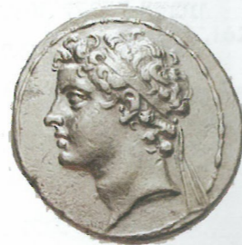
אנטיוכוס החמישי מטבע כסף שנטבע באנטיוכיה

לאחר מותו של מתתיהו עברה הנהגת המרד ליהודה, אחד מחמשת בניו. הוא ואנשיו הצליחו להשתלט על האזורים הכפריים של יהודה ועל הדרכים המובילות אל ירושלים. המתיוונים וחיל המצב הסורי היו מרוכזים בפוליס אנטיוכיה בירושלים, והמטרה הייתה להשתלט על השטחים סביב לירושלים כדי ליצור הסגר על העיר. הקרבות הראשונים של יהודה מול הסורים היו באזורים בהם היו דרכים שהובילו לירושלים, ובהם זכה יהודה לניצחון מוחץ.