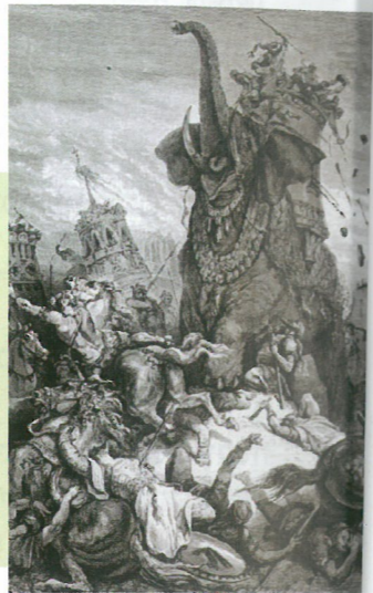
אלעזר החשמונאי נמחץ תחת פיל בניסיונו לתקוף את ליסיאס, גוסטב דורה, צייר צרפתי, 1830-1883, תחריט נחושת