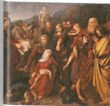
פלוגת חיילים הגיעה לכפר מודיעין, בו התגוררו החשמונאים, וביקשה לכפות בכוח על התושבים עבודת אלילים, צייר פולני, 1800-1875

המטרה המרכזית, שהתמקדה בעיקר בתחום האוטונומיה הדתית, הייתה לבטל ולסלק את ההתייונות. הגורם הראשון אם כן ליציאה למרד הוא הרצון להחזיר את חוקי התורה לירושלים ולסלק את השפעות המתיוונים - האליטות המושחתות בעיני המורדים. מדובר כאן לא רק במאבק נגד השלטון הסלווקי להשגת אוטונומיה דתית, אלא גם במלחמת אזרחים. כאשר מתתיהו קורא "מי לה' אלי", הוא קורא גם למרד באלה מן היהודים שעזבו את דרך ה'.